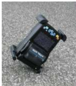
Защита от падения