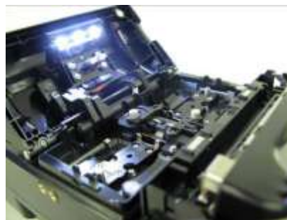
Светодиоды подсветки: 3+1