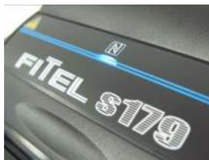
NFC: Контроль доступа к аппарату